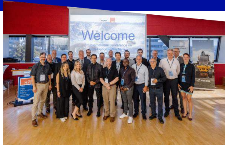
MICA Delegation—High Performance Mining Conference Germany

Organisée en collaboration avec VDMA Mining, les entreprises membres de l'ACIM ont passé du 4 au 8 septembre 2023 en Allemagne pour mieux connaître l'industrie minière allemande, rencontrer des manufacturiers et assister à la conférence High-Performance Mining (HPM), organisée par le groupe Advanced Mining Technology (AMT) de l'université RWTH Aachen.